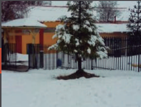
Escuela Municipal Pablo Neruda