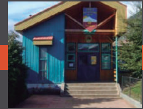
Escuela Municipal Victor Domingo Silva