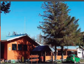
Escuela Municipal Río Blanco.