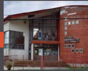
Escuela Almirante Simpson Puerto Chacabuco