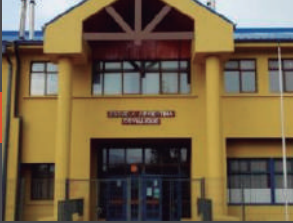
Liceo República Argentina