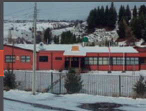
Escuela Municipal Valle La Luna