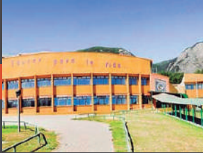
Colegio Particular Camino a la Fuente