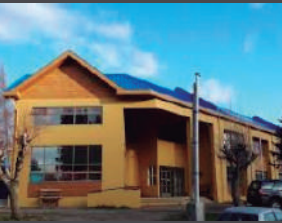
Liceo Altos del Mackay