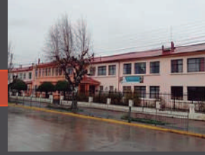
Escuela Municipal Pedro Quintana.