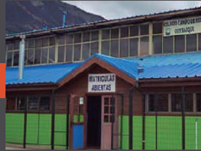
Colegio Particular Campo de Hielo.