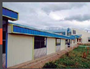
Escuela Municipal Valle Simpson