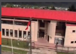
Liceo Politécnico Puerto Aysén