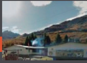
Escuela Arroyo El Gato