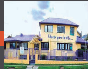
Colegio Particular El Camino